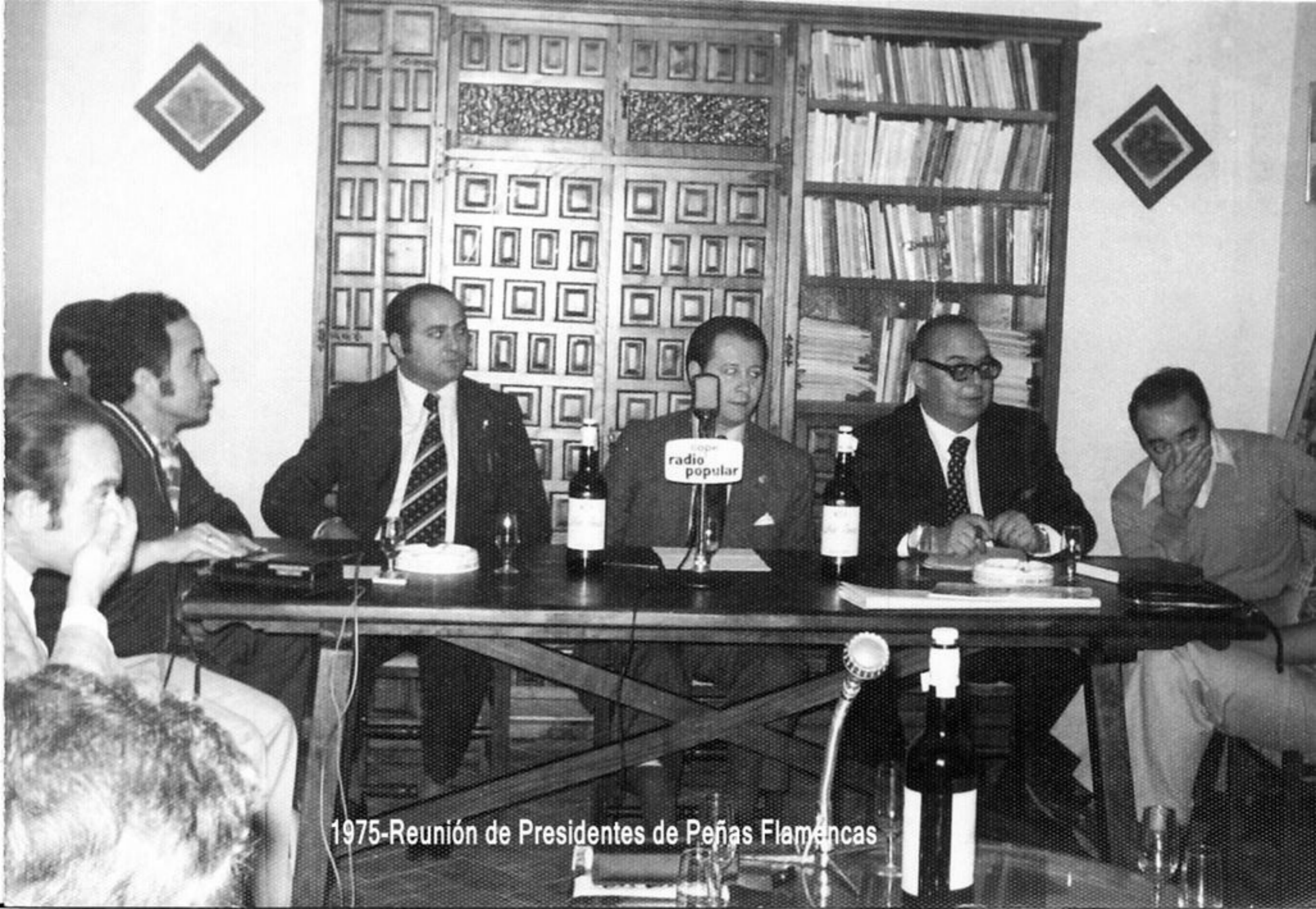
1975-Reunión de Presidentes de Peñas Flamencas